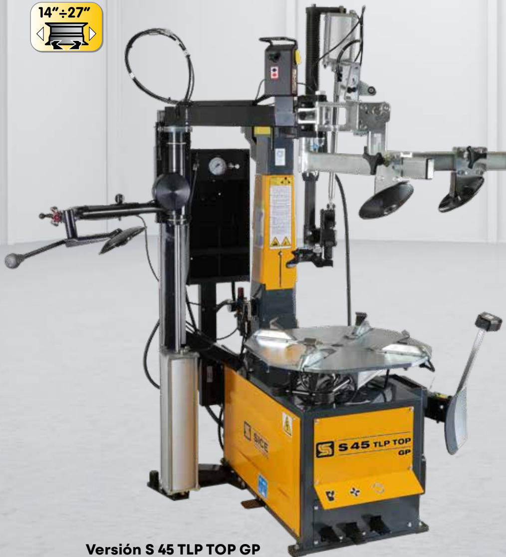
Versión S 45 TLP TOP GP

Desmontadora automática "LevalaLeva" totalmente equipada